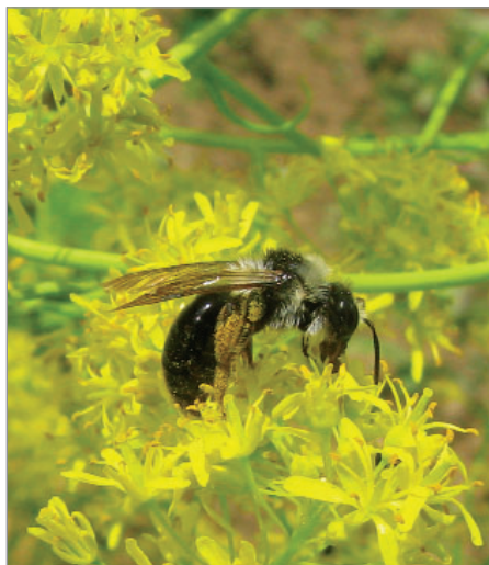
Včela samotářka na dvouletém borytu barvířském.

brutnák (modré květy, bez zákrovu jedlé, pěkná dekorace), krásenka: cigánky, Světlá směs Reszel-Orneto (také k řezu), fazol šarlatový: Fazorka, Velká strakatá hnědá, Tříbarevná k pergole, Velká bílá, papuče, Lůžňanka, Černá Slovenka, Chropyňské šváby aj. (na květech často žlutásek řešetlákový a včely, zpravidla