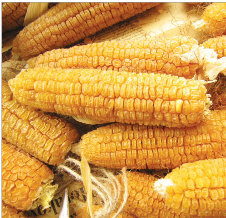
Ranou odrůdou je cukrová kukuřice Sachara..

tak, aby byly v potomstvu zachovány typické a cenné vlastnosti odrůd. (Podrobněji o semenáření a výběru viz knihy o osivaření Pěstujeme si vlastní semínka a Semínka z vlastní zahrady). Jsou to všechny odrůdy uvedené na stránkách gengel.cz, tedy například výše zmíněné sorty krajové, ale i odrůdy staré, rodinné a další.