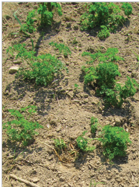
Pro petržel kadeřavou volíme ve druhém roce, kdy půjde do květu, široký spon, odrůda Ukrajina.