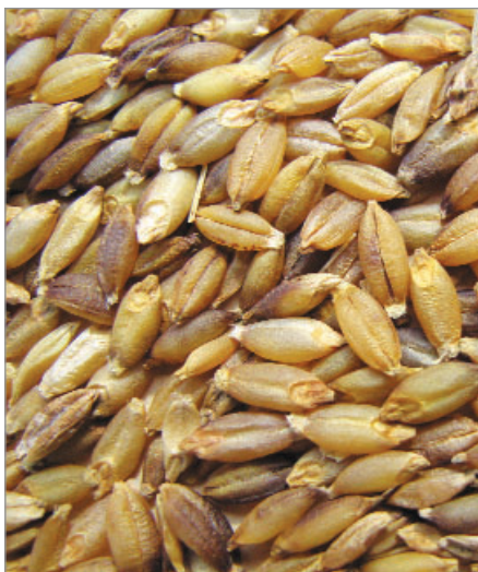
Zrna nahého krajového ječmene gengel.

V následujících bodech přinášíme několik různých pohledů na gengelské odrůdy. Ty mohou pomoci zejména začínajícím semenářům, kteří se chtějí podílet na uchování kulturního bohatství odrůd. Jednotlivé skupiny odrůd mohou být samozřejmě různě spojovány a kombinovány, vzájemně se totiž prolínají. Odrůda krajová je například nejen vhodná pro danou oblast, ale v květu nakrmí naše