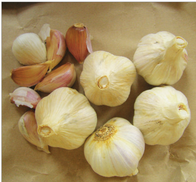
Mezi vegetativně množené druhy náleží i česnek, na obrázku rodinná odrůda Kovaříkové.

Vyšlo jako příloha Zpravodaje biodiverzity a uchování starých odrůd č. 4/2020 (srpen/září 2020)