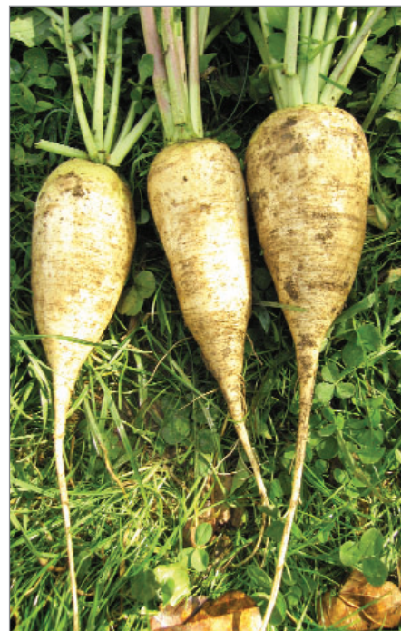
Vybrané kořeny dvouleté Mnichovské pivní ředkve.

časně, včely), mangold Mongold, řepa krmná Jarabina (květenství u nás stále obležené pestřenkami), komonice lékařská (vysoká, kvete dlouho), tuřín (u nás průměrná návštěva včel), kmín: Moravský, Valašský (drobný hmyz, kmín někdy kvete až třetím rokem), lžičník lékařský (kvete bíle, časně), ředkvička/ředkev: Bílá kulatá, Máslová obří, Mnichovská pivní ředkev (pestřenky a včely, dáváme oporu)