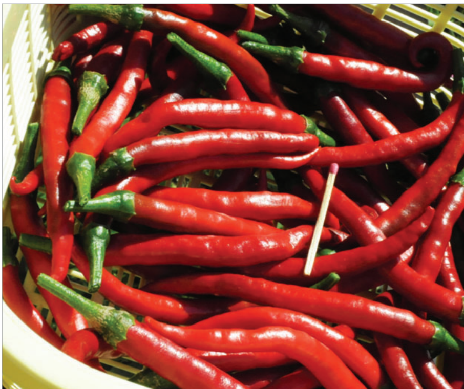
Paprika Maďarská štiplavá.

Podle našich gengelských zkušeností jsou jednodušší, lehčejší semenářsky zvládnutelné i některé dvouletky. Jsou to zejména ty, které se přezimují snadněji (například se nekazí přes zimu) než ty s kořenem či hlávkou. Přes zimu mohou být často i venku na záhoně – listová petržel Ukrajina (kadeřavá), Gruzie (hladkolistá), kozí brada Blanc Amélioré, Gasparin, Tábor, pastinák Z jezuitské zahrady, celer serina (listový typ celeru pro sklizeň natí), ředkev Mnichovská pivní ředkev (kratší bílý kořen). Dvouleté jsou také některé byliny jako např. divizna, boryt, ostropes trubil aj., které tvoří v první roce listovou růžici a kvetou druhým rokem. Ty jsou semenářsky obvykle jednoduché a bez problémů.