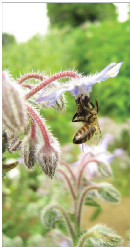
Včela visící na brutnáku. Brutnák je výbornou medonosnou plodinou doporučovanou včelaři.

divizna (mnoho druhů hmyzu, včely samotářky, žlutý květ, léčivka), srdečník (u nás stále hučí včelami), pastinák Z jezuitské zahrady (malá zoologická zahrada s až desítkami druhů bezobratlých), boryt barviřský, boryt skanzen (dáváme oporu, bývá vysoký, kvete časně), barborka (brukvovitá, též kvete časně zjara), ostropes trubil (včely v květech dělají stojky, aby se dostaly k potravě, vysoké ostnité rostliny), kozí brada: Gasparin, Blanc Amelioré, Tábor (u nás ji mají rády včely samotářky), pilát (tmavě modrý květ, „brutnákův bratr“), užanka psí jazyk (tmavě červené květy, kvete poměrně