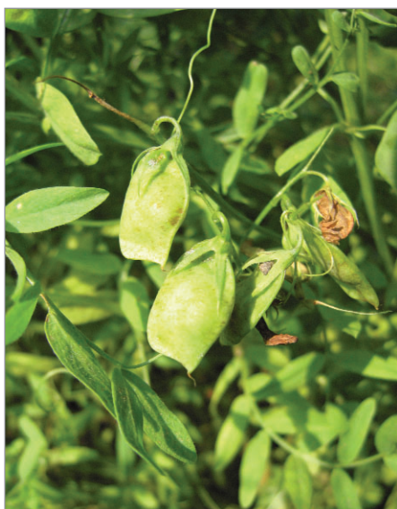
Na jižní Moravě se dříve tradičně pěstovala i čočka, jednou ze zachovalých odrůd je Valtická haléřová.

rozmarýn Z valašské světnice, pohanka Trojanovice, mák: Mák modrý Valašsko, Z Hajdových pasek u Zdechova, Bílý z Vranče, Po stařence, kmín Valašský, netřesk Z hrnců aj.