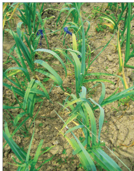
Česnek z Miřejovických strání u Litoměřic byl nalezen na opuštěném pozemku jako sudetská odrůda.

Pováží – česnek Púchovský zamouralý, mák: Bílý od Púchova, trasený mak, Súľovský, fazol: Púchovská zelenkává, Staroturanské strakaté, Mária, Fazule