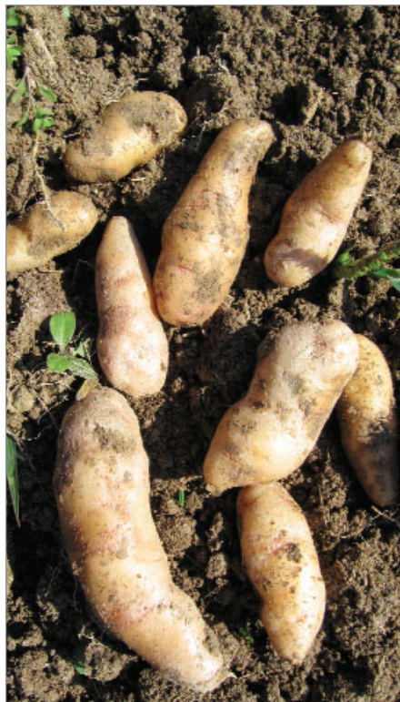
Brambory Bamberské rohlíčky přišly do gengelské sbírky starých odrůd z Německa.

Francie – fazol Koko z Prahy (Coco de Prague), Svatý duch s červeným okem (Saint Esprit a oeil rouge), kozí brada Blanc Amélioré, rajče divoké žluté (pídi z Francie)