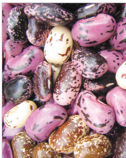
Odrůda šarlatového fazolu Becoky z Návší.