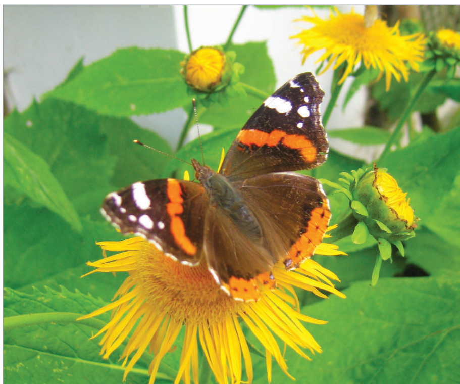
Květy kolotočniku milují různé druhy motýlů.

Slovenské odrůdy – proso Slovenské červené, fazol šarlatový Černá Slovenka, špenát Slovenský vysoký, čirok metlový Slovenský