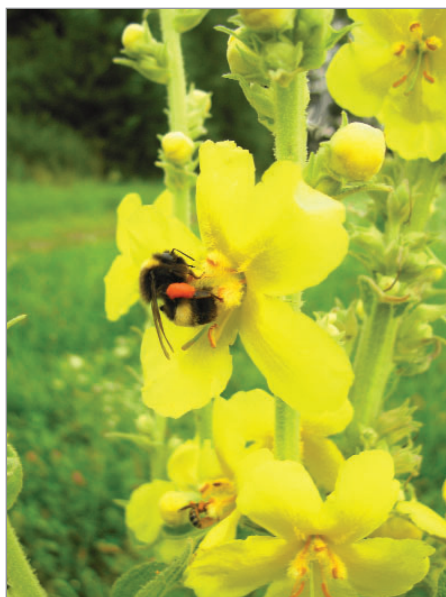
Čmelák sbírá na květu divizny, jež je dvouletou rostlinou.