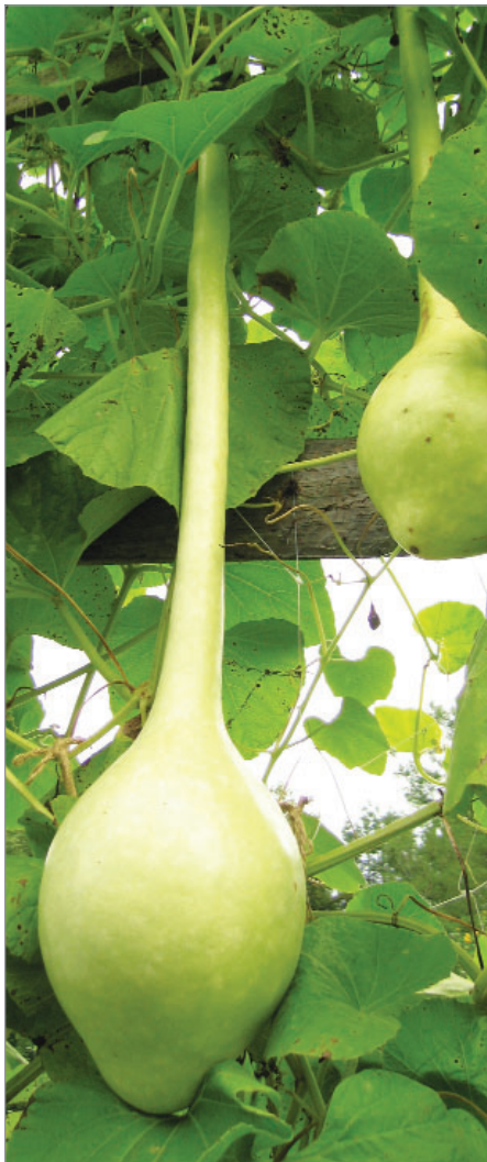
Plody lagenárie se na jižním Slovensku používaly na „stahování vína“ jako košťáče.

Tyto druhy se velmi často udržují na zahradě samy, bez velké péče a starostí se semenařením. Někdy mohou až zaplevelovat a stát se obtížnými, pokud je neusměrňujeme. Jde zejména o kvetoucí