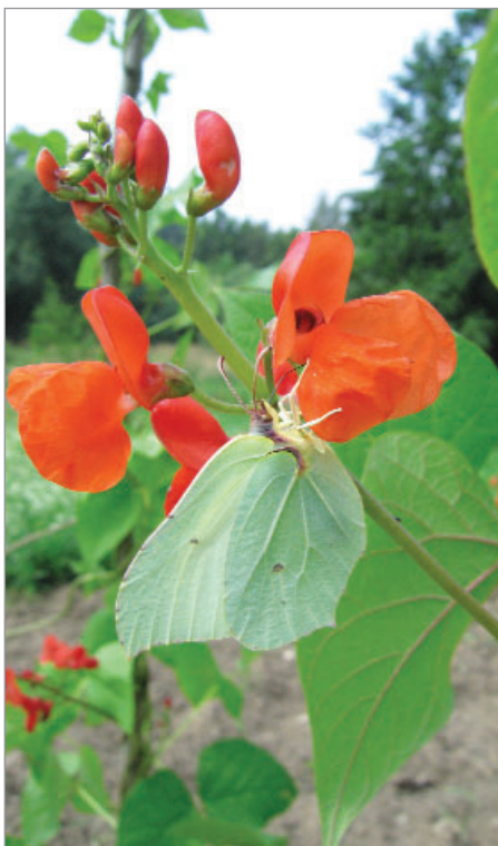
Krajový šarlatový fazol, zde sorta Fazorka, láká včely i motýly. Na záběru na květu žlutáček řešetlakový.

hlavní užitek jako luštěnina či zelenina), sléz maurský (kvete dlouho, okrasný), měsíček (sem tam něco létá, květy do čaje a na mast, kvete dlouho), chrpa Horní Záblatí (potěší oko, i jako kytička do vázy, též ozim, samovýsev), ostrožka (libují si ní čmeláci, má hlubší květ), hořčice rolní, černucha damašská, černucha rolní, slunečnice: Jarabina, Ruská, Kanadská (dobrá letní pastva), mák (kvete poměrně krátce, ale je na něm množství včel i pestřenek), kopr: Čiernoklačanský, kopr, Z Kančích hor (různorodé složení zvířátek, samovýsev), pohanka: Trojanovice, 93, Conrad (kvete po delší dobu, medonosná), štěrbák Eskariol zelený (čekankové modré květy), Inička setá (žlutý květ, olejní), tykev obecná a velkoplodá (včely)