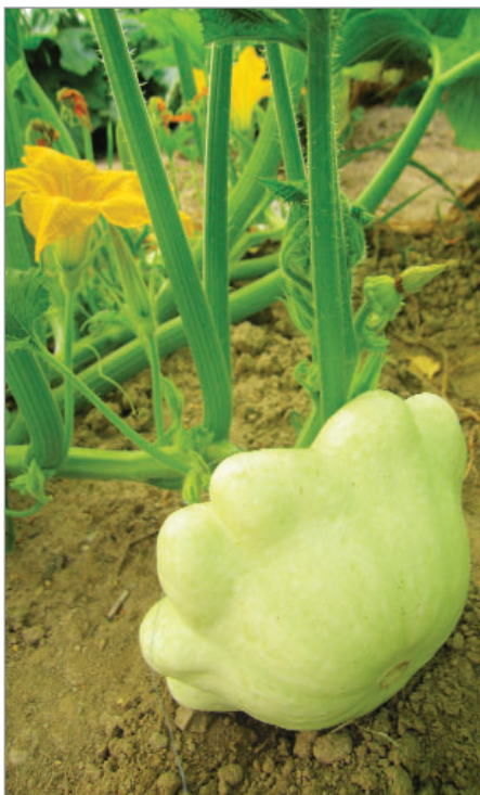
Plod patizonu Budapešť.

Sem spadají druhy, které se běžně nepěstují, často je ani nelze získat v obchodní síti, kde se prodávají osiva.