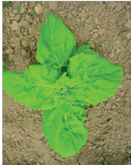
Lebeda zahradní, odrůda Stromový špenát, je chutnou a nenáročnou zeleninou.