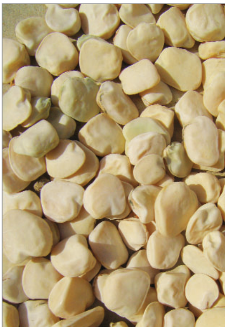
V mnoha oblastech Slovenska byl pěstován jako luštěnina hrachor setý, na obrázku krajová sorta označovaná jako cícer z Čachtíc.

Slovácko – fazole: Sirkové, Šparglové, Bánov II, Bánov IV, Léčivá z Uherského Hradiště, Mikysková I, Mikysková II, hrachor Slovácko, česnek: Strážnický bílý, Kovaříkové, pšenice: Slovácká hnědokolásá osinatá, Hodonínská vouska