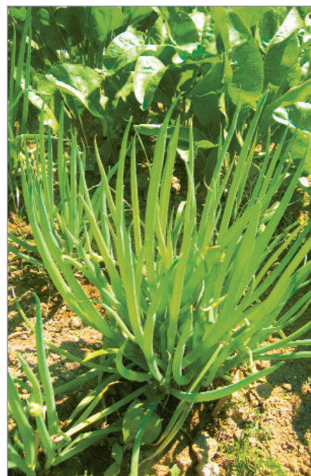
Netradiční zeleninou je naťová zimní cibule, zde sorta pojmenovaná Z Huslenek (z Kazachstánu).