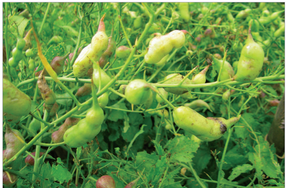
Z ředkve krysí se požívají její dužnaté a příjemně pikantně chutnající šesule.