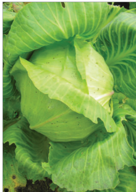
Zelí, Krajové ze Spiše, je též dvouletkou.

šanta kočící: Vlčická, Zdice (vzhledem připomíná kopřivu, samovýsev), cibule zimní: Maďarská, Z Huslenek (včely medonosné), slézovec durynský (kvete dlouho), sléz pižmový: bílý, červený, (vče-