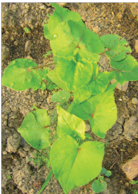
Typickou plodinou Valašska byla pohanka, na fotografii mladé rostliny krajové odrůdy pohanky z Trojanovic.

opylovače a je pěkná i na pohled, tedy poslouží jako okrasná rostlina. U některých odrůd uvádíme v závorce postřeh z jejich pěstování a vlastností podle našich zkušeností v Gengelu, údaje o původu apod.