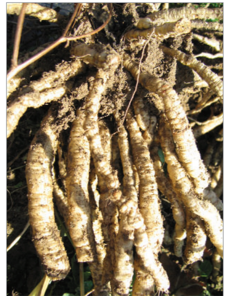
Sevlák cukrový je vytrvalou zeleninou, pěstovanou kdysi pro nasládlé kořeny.

byliny, květiny a plevele uvedené u opylovačů (brutnák, krásenka, koukol, měsíček, ostrožka, divizna, ostropes trubil, komonice lékařská, sléz maurský, srdečník, šanta kočičí, boryt, barborka, agastache, černucha, užanka, kopr apod.). Spadají sem ale někdy také různé druhy zeleniny, jako lebeda zahradní, saláty, ředkve, ředkvičky, mangold, rajče divoké a mnohé další. Podmínkou je ponechat semena uzrát a ta následně i samovolně vypadnou, příp. jde o ztráty při sklizni. Vzniklé rostlinky lze buď přesadit, nebo nechat růst na místě.