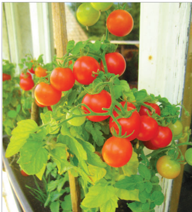
Rajče Čerešňkové je rané a vhodné do truhlíků.