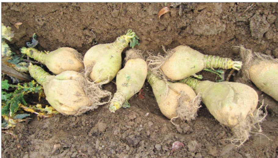
Mezi semenářsky náročné dvouleté druhy patří i tuřín, na záběru bulvy krajového tuřínu z Terchové uložené k přezimování v půdě.