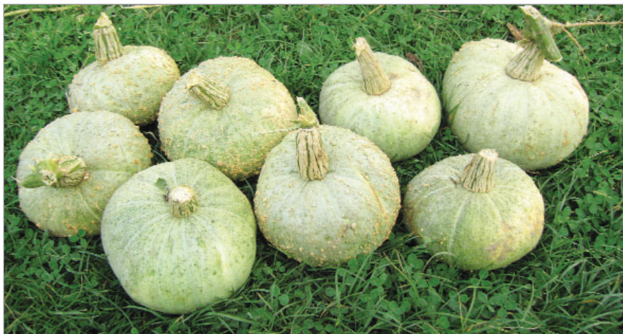
Východní Slovensko je domovem různých tykví, zde plody pečárky, které se dříve pekly v peci pro pečení chleba.