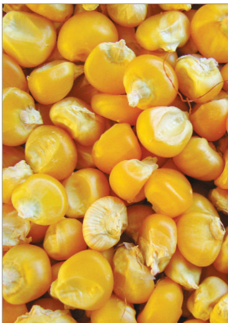
Kukuřice z Podkarpatské Rusi má žluté zrno.