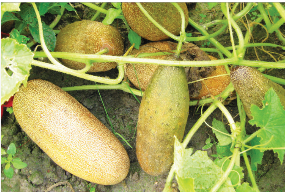
Zralé plody okurek Od Kuchařky Nataši – sorty, jež k nám připutovala z Ukrajiny.

Jsou to koukol rolní, ostrožka, chrpa Záblatí, sveřep stoklasa, jílek mámivý – často okrasné svým barevným květem, některé lákají hmyz, patří k druhům které se snadno udržují i samovýsevem . Lze je ale, na rozdíl od vytrvalých, houževnatých plevelů typu pýr, bršlice nebo pcháč, snadno omezit včasnou, lehkou okopávkou nebo plečkováním. Snáší většinou dobře i přesazování.