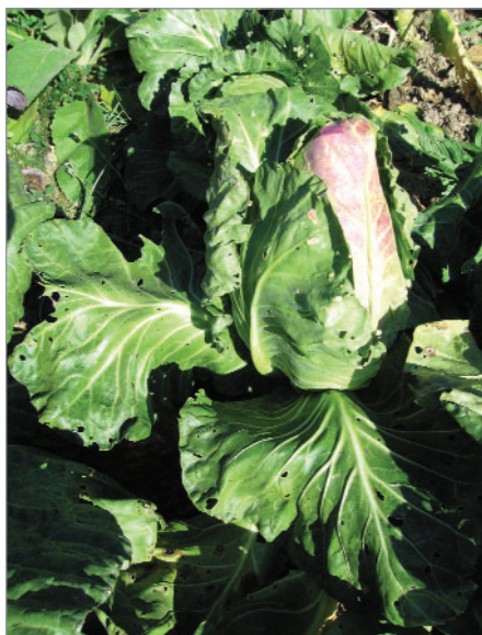
Původní krajovou odrůdou bylo Křimické zelí z Plzeňska. Je pozdní a tvoří špičaté hlávky.

Jižní Morava – okurky Znojenské, paprika Břeclavská s rypáčkem, fazol: Vranov, Znojenská (Haladova), Strakatá z Násedlovic, Ivančická černá, pšenice Židlochovická Lada, čočka: Valtická, Moravská drobnozrná, hrách Moravský hrotovický krajový, tykev Semenopražka, česnek Bzenecký paličák, chřest Ivančický špargl