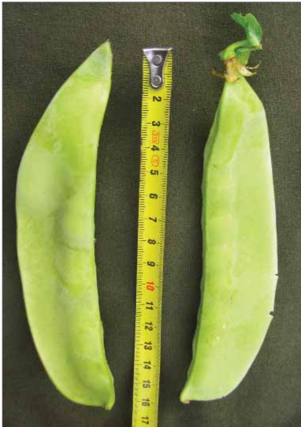
Změřená délka lusku gengelské hrachové odrůdy Obří z Hořic ze dne 4. 7. 2019 dosahovala 16 cm, šířka pak téměř 4 cm.