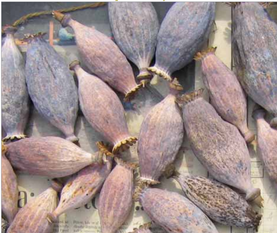
Velké makovice odrůdy Ruský obří.

Odrůdy velké – s velkým semenem/plodem/sklizňovou částí – fazol šarlatový: papuče, Velká strakatá hnědá, Lvovský z Ukrajiny, pšenice polská, bob: Velký z Blatničky, Vojka, hrách: Obří z Hořic, Ruský, mák: Ruský obří, Červený velký, Černý, rajče: Ruské masové, Stichovice, Leščukovo oranžové, Kulaté velké, Kosmonaut Volkov, rebarbora Hanácké lopón, šalvěj Dalmatská velkolistá, řeřicha velkolistá, česnek: Velký z Dubovan, Ruský z Lipnice aj.