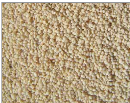
Semeno odrůdy Bílý mák z Biskoupy.

Bílý mák I (Pardubicko), Liečivý, Mák bílý z Vranče, Bílý mák II (od Lanškrouna), Bílý mák III (Hejduk), Bílý mák od Púchova, Bílý mák z Biskoupy, Bílý mák z Dobré,