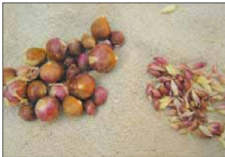
Srovnání velikosti tzv. velkých a malých pacibulek: Vlevo velké pacibulky odrůdy Z Miřejovických strání u Litoměřic (dříve Pospa), vpravo malé pacibulky odrůdy Ruský z Lipnice.

S náboženským obsahem jména – Svatá Trojice, Svatý duch s červeným okem, Svatá Helena-Krušné hory, Mária, Andělské, Svatý Ján, Antoníček černý, Antoníček červený.