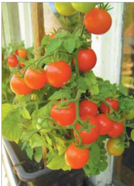
Do truhlíku se osvědčilo nízoučké rajče Čerešničkové s třešňovitými plůdky dobré chuti.

rajčata typu divoké rajče – necháváme je plazit po zemi, bez vyvazování a vyštípování. Rozrůstají se, pokud mají místo, paprscitě do stran a pokryjí i velkou plochu půdy. Vyvazování je v případě zájmu možné. Bývají spíše pozdnější než ranější, doporučujeme nehnojit organicky, aby zbytečně nebudely do zelené hmoty, ale plodily – divoké červené, divoké žluté (pidi z Francie), Pidi rajčátko Erfurt, Klokani.