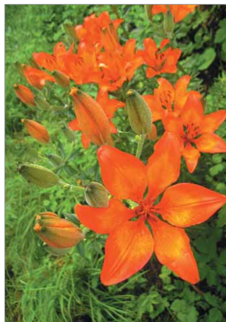
Mezi okrasné druhy patří lilie cibulkonosná Stádlá s voňavými květy.

Okrasné druhy afríkan Garafia, ostálka Čiermoklačanská, lilie bílá Velké Přílepy (tzv. kostelní), lilie cibulkonosná Stádlá (ze sudetských rozvalin), měsíčnice, chejrovonný Fiala voňavá, oman, kolotočník, krásenka: cigánky, Světlá směs Rezsél Orneto, netěsek Z hrnce, řebříček bertram Z Duban, muškát: Borovanský (klasika – červený květ), Voňavý muškát proti komárům (sice nekvete, ale voní příjemněji než jiné muškáty), topolovka: Sléz Heřmanův Městec žlutá bílá, Z Waldviertlu, Topolovka černá, Topolovka červená Vršovice (velké květy, lákají včely), divizna, sléz maurský, sléz pižmový, hvozdík Prachaticko.