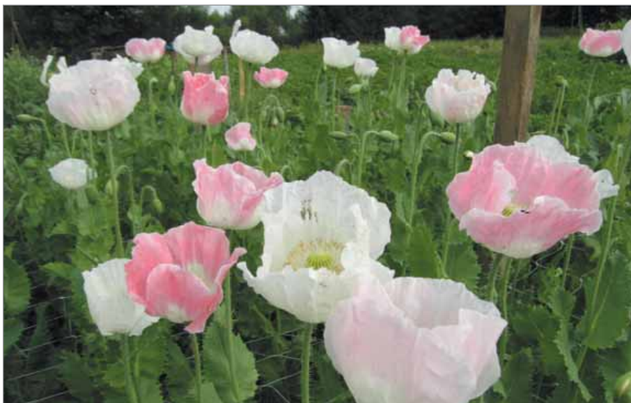
Květy bělosemenné rodinné odrůdy Bílý mák I Pardubicko jsou barevně rozmanité.

S barevnou slupkou – červené Bojar, fialové až modrofialové Modřáky, Valašské Modřáky, Boumoočky, Aaran Victory.