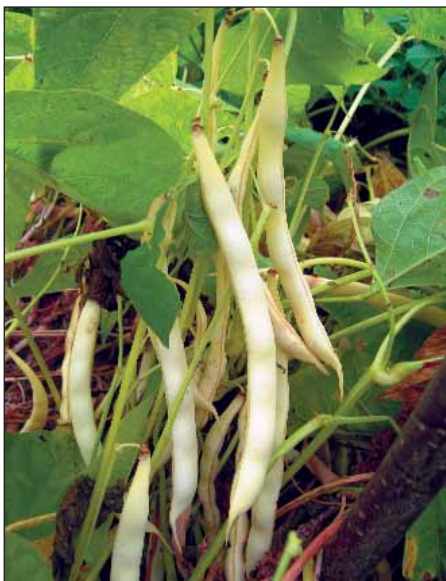
Na zeleno (Szabó) svým jménem naznačuje využití mladých lusků.

Bílé semeno – Moravská perla, Vysoko úrodná řahavá biela, Perlička, Muellheim, Velká bílá, Vranov, Od babičky Líby, Křída, Šparglovky z Polně, Cukrová perla, Hanácká