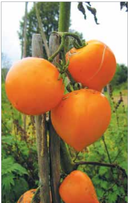
Odrůda Dívčí prs má větší, žlutooranžově zbarvené plody a je pozdní.

tyčkové (vyžadují oporu, podle odrůdy i dostatečně vysokou) – Black Cherry, Black Plum, Černý princ, Červená hruška od tety, De Berao, Dívčí prs, Hanácká hruštička, Hanácké nejranější, Vaňkovo hroznovité, KBX, Kosmonaut Volkov, Krab jaronský, Kulaté velké, Leščukovo oranžové, Limon Liana, Malé cukrové,