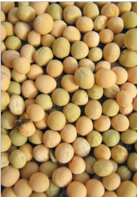
Kulatosemený luštěninový Moravský hrotovický krajový.

Hlavní využití je jako luštěnina, na vaření suchých, vyzrálých semen. Na zeleninové použití se, aby byl hrášek dobrý, sklízí jen v dosti mladém stavu.