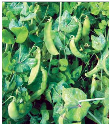
Odrůda 1541 je slovenský cukrový hrách.

Cukrové hrachy – lusk je bez tuhé blány v chlopních, pojídá se celý. Sklízí a konzumuje se, když lusky dosáhly své plné velikosti, ale semena uvnitř jsou ještě malá, nevyvinutá. Chutná křehce, šťavnatě, sladce. Dobré jsou lusky čerstvé, po syrovu, ale i krátce tepelně upravené (dají