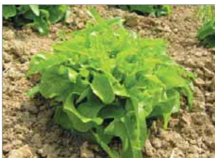
Salát Dědy Švejdy je pozdnější, dubolistý a může se sklízet jak postupně trháním jednotlivých listů, ale i naráz, utržením celé hlávky.

Plzeňský kamenáč, Stupický kamenáč (typově oba podobné, Stupický zůstává trochu stranou pozornosti).