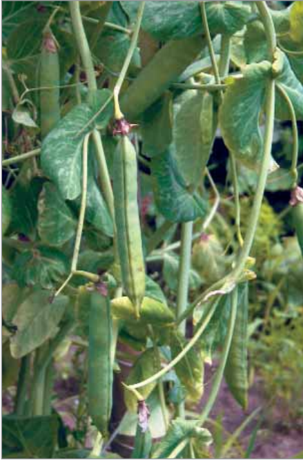
Mezi dřevňové hrachy patří Ruský.

Kulatosemené, luštěninové hrachy – někdy ve starší literatuře nazývané také jako tzv. hrachy k vylupování. Semeno je ve zralosti kulaté, žluté nebo zelené barvy.