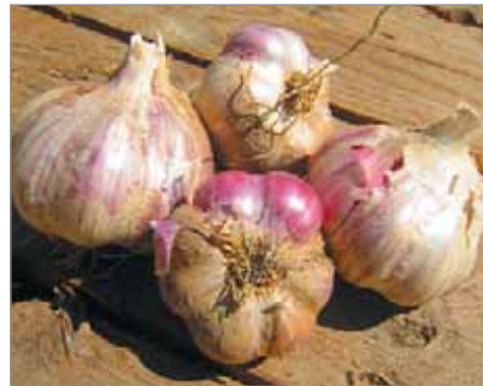
Odrůda nazvaná Velký fialový má fialově zbarvené hlavičky.

Ruský, Ruský z Lipnice, Z Hané, Modrý, Strážnický bílý, Púchovský zamouralý, Od prabábky, Kovaříkové, Rusák, Oravský, Kozlův paličák.