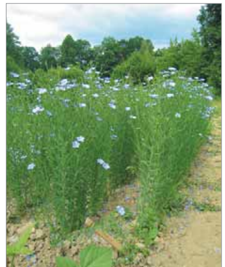
Odrůda Deutscher Oellein má nižší, bohatě větvené rostliny a přináší velké olejnaté semeno – je zástupcem olejného lnu.

Maďarská štiplavá, Velké Ludince (rodinná odrůda), Feferonka dobře štiplavá maďarská (asi všechny maďarského původu), Bulharská žlutá (žlutá v botanické zralosti).