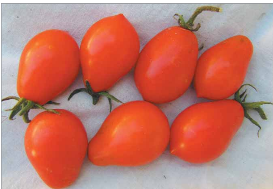
Červená hruška od tety tvoří drobné plůdky přibližně hruškovitého tvaru dlouhého jsou červené, protáhlé a mají sušší dužinu vhodnou na přípravu leča.