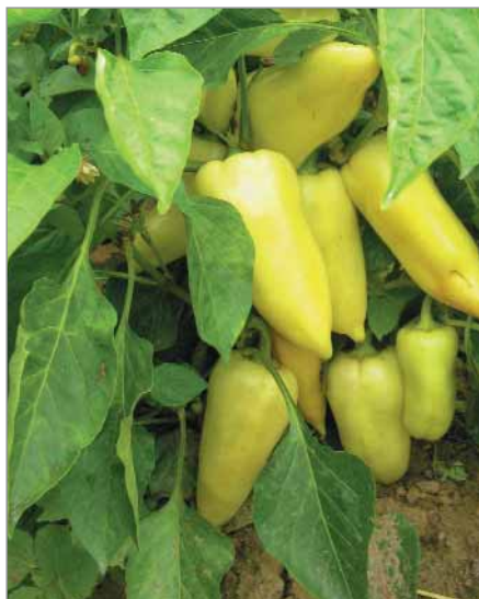
Slovenská paprika Biela hrubostená přináší bohatou úrodu, ověřila jak na poli, tak ve skleníku.

Moravská ovocná (stará odrůda, pozdní), Severka (ranější, oblíbená a osvědčená v mnoha oblastech, někdy se plody zbarvují během růstu do fialova – barviva antokyany, nejedná se o nemoc), Česká raná (hlídat při výběru, aby plody nebyly pálivé), Biela hrubostená (slovenská, ranější, osvědčila se na poli i ve skleníku,