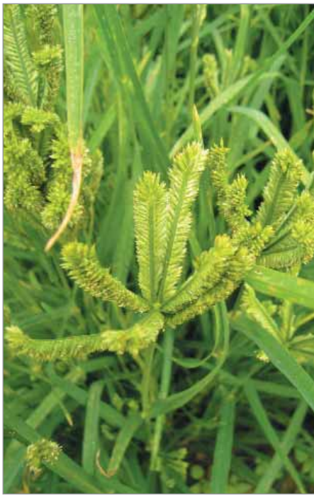
Kalužnice křivoklasá má zajímavý klas.

Méně známé a netradiční obiloviny – často jsou dekorativní, okrasné a zajímavé i na pohled. Pro zpracování je třeba pamatovat na to, že jsou zpravidla pluchaté (zrna jsou v obalech ve slupce, vyžadují loupání) – proso: Fialové, Hanácké mana, Slovenské červené, Proso VERN-PSR, čirok obecný: čirok obecný, Proso je krásné, čirok metlový (na výrobu kartáčů a metel), Slovenský (vysoký, delší vegetační doba), tatar (z Banátu, ranější, pěkně červený), rosička krvavá (sklovité drobné zrno, roste i na chudých půdách), kalužnice křivoklasá – tzv. korakan (větvený klas; nižší, nepoléhavé rostliny), ježatka obilní (pěstována jako obilovina v teplých krajích), amarant (také jako okrasa): Amaranthus caudatus var. edulis , Amaranthus hypochondriacus Červený, Nízký červený, ječmen Tábor 811 (tmavé zrno – tzv. Kafeegerste), bér (jeho zrno byla loupána dříve podobně jako proso na jáhly brové (=jáhly z bėru) – krajový červený, Uličské Krivé (krajový z Východního Slovenska), Čiernoklas (novější odrůda z roku 1970).