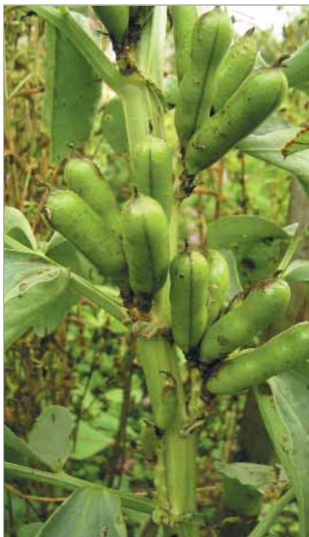
Lusky bobu Kanadská káva obsahují drobná semena.

Odrůdy malé – tvoří sice velikostně malé plody/semena/sklizňové části, ale ty jsou často chutné, násada je mnohdy početná (mnoho plodů). Bývají ranější než odrůdy velkoplodé – fazol: Perličky, Vysoko úrodná řáhavá biela, Moravská perlička, salát: Plzeňský kamenáč, Stupický kamenáč (za mírné zimy může přezimovat jako sazenička), rajče: rajče divoké červené, Od dědečka z Pelhřimova, Červená hruška od tety (hruštičkovitý tvar plodů), Čerešnickové (osvědčené pro truhlíky), Šery rajčina, bob Kanadská káva (velmi drobné černé semeno, nejmenší z bobů), čočka Moravská drobnozrnná (nejmenší z našich čoček, v pěstování vyžaduje oporu), hrách: Paleček (velmi nízký, asi 30 cm), Weggisský (cukrový, dlouho nasazuje lusky), pažitka Jemná tenká, česnek Z Moravy (malý, ale trvanlivý, vydrží dlouho), brambor: Pink fir Apple, Bamberské rohlíčky (maličké, ale obě odrůdy mají pevnou dužinu), topinambur Malý fialkový (opravdu maličké hlížečky, pěkná barva), rosička krvavá (zvaná česká rýže, ve rovnání s běžnou rýží je to spíš miniryžička, zrníčka nutno loupát),