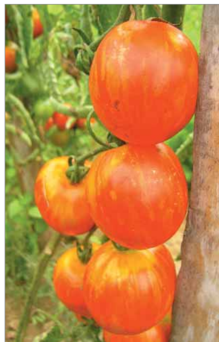
Odrůda Tiger Tom má plody žíhané.

Sušší dužina – De Berao (odolnější plísni), Pražské dlouhé (osvědčené do leča spolu s paprikou), Pražské dlouhé žluté (jeho žlutoplodá obdoba), Roubíčkovy pupíkaté (rodinná sorta).