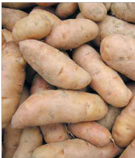
Brambory Pink fir Apple jsou malé, rohlíčkového tvaru, pevné dužiny.

Kulovité až kulovitooválné – Aaran Victory, Karmen, Kardinál, Táborky, Boumoočky, Bojar (až dlouze oválné).