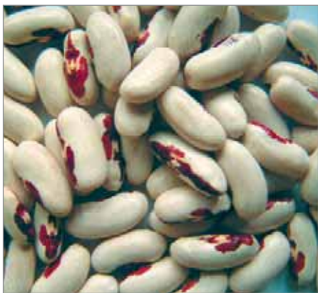
Keřičkové Florianky, s barevnou kresbou postavy na semeni, se užívají jako luštěnina.

fleky podle plemena psa), Melis Suedtiroler, Kamínkové (s proužky na semeni, ze Zakarpatské Ukrajiny), Kamínkové zo Záhoria, Strakatá z Násedlovic (červenobílá, rodinná), Kujavské (černobílé), Máslová královna (stará odrůda), Markušovce (černobíle stříkané), Červenobiela odolná (ze severu Slovenska, podobná Plazivce).