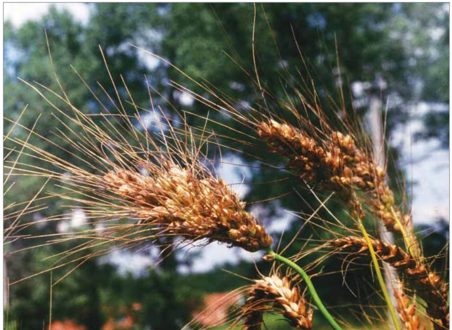
Větvený klas u pšenice naduřelé Osiris