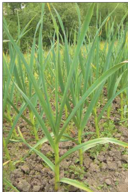
Ruský z Lipnice je ozimý paličák.

K bohatství odrůd česneku viz Mapa česneku a šalotky – Zpravodaj starých odrůd č. 5/2019, Doma v záhrade č. 9/2019 a Knihovnička. Doporučení k pěstování a udržování odrůd česneku viz též Zpravodaj starých odrůd č. 5/2019.