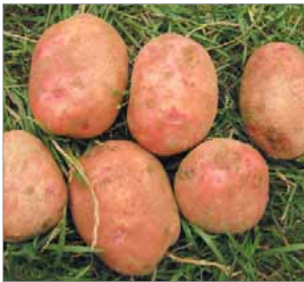
Stará česká odrůda Bojar má červené hlízy, moučnatou dužinu a přináší spolehlivé, stále výnosy.

Dlouze oválné – Norma (stabilní vyšší výnos, dobře se škrábou)