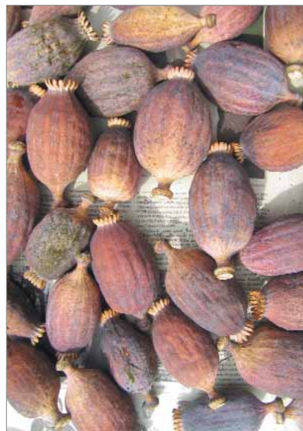
Velké makovice odrůdy Černý mák mají načervenalou barvu.

K bohatství a rozmanitosti odrůd máku viz též Maková mapa Bio č. 6/2018 a Knihovnička.