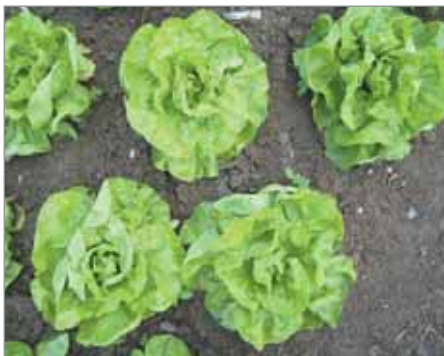
Hanácký letní tvoří velké okrajové listy a jen malou hlávku.

Do výběru jsme zařadili ty druhy, které jsou v Gengelu odrůdově početněji zastoupeny. Jde o salát, hrách, fazole, rajče, len, mák, brambory, papriku a česnek. Volně tak navazujeme na Pomocník pro výběr odrůd, který jsme přinesli ve Zpravodaji starých odrůd č. 4/2020. V něm jsou gengelské odrůdy členěny např. podle původu z jednotlivých krajů českých zemí i Slovenska, přitažlivosti pro opylovače nebo náročnosti při semenaření.