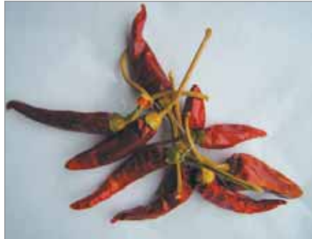
Suché plody pálivé papriky Velké Ludince.

K bohatství a rozmanitosti odrůd hrachu viz též Mapa hrachu – Zpravodaj starých odrůd č. 5/2020 a Knihovnička.