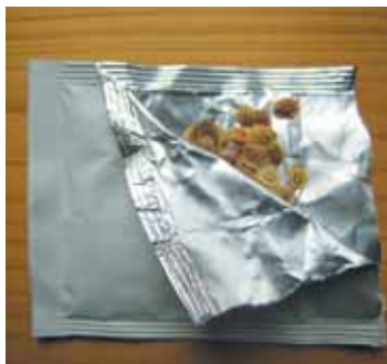
Vnitřní vícevrstvý sáček zvyšuje ochranu semen.

Sáčky po roce 2000 a ze současnosti se již staly mezinárodnějšími či světovějšími a někdy se téměř předhánějí v kolika jazycích bude návod k pěstování uveden: ve čtyřech jazycích je tomu u sáčku Semena Veleliby a Nohel Garden se honosí jazyky dokonce sedmi(!) a nápisy jsou: česky, slovensky, německy, anglicky, polsky, maďarsky, rumunsky. Švýcaři si vystačí opět se svými třemi jazyky (Select). Zatímco u nejstarších obalů z počátku devadesátých let je jen textový popis, u novějších pytlíčků je téměř vždy i „obrázkový návod“ k pěstování, čili tzv. piktogramy – obrázkové znaky informující o termínu a hloubce setí, možnosti předpěstování, doporučeném sponu setí, určení, zda je pro kryté prostory či venkovní pěstování, dobu sklizně sklizeň apod. Nebo jsou tyto