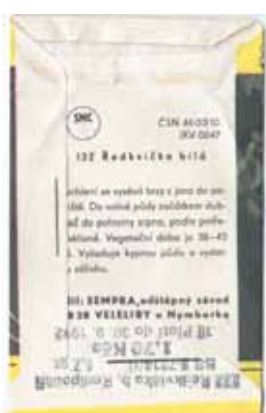
Zadní strana balení Sempry. Oproti dnešním vícejazyčným popisům jsme si tehdy vystačili jen s češtinou.