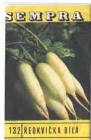
Sempra vyfotografovala kratší, až téměř válcovité Rampouchy.

Rozdílné je vnitřní uložení semen. Novější osiva jsou zpravidla, kromě vnějšího barevného papírového obalu, ještě opatřena menším vnitřním vícevrstevným sáčkem s neprodyšnou papírovo-hlínikovo-plastovou stěnou. Takový sáček, pokud je neotevřen a nepoškozen, chrání semena proti vlhkosti. Starší balení, kde jsou semínka ukryta jen v papíru, vyžaduje vhodné skladovací místo, aby nedocházelo k zvlhnutí osiva. Poznámka ke skladování u novějšího sáčku Gardenson, který vnitřní ➔