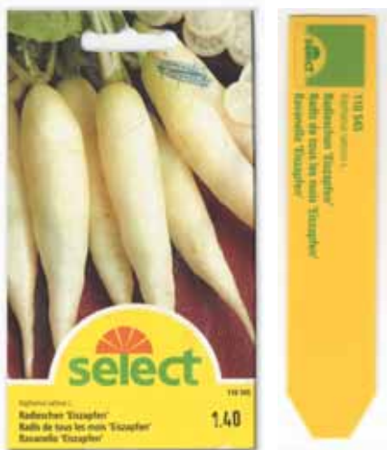
Švýcarský sáček Selectu obsahoval kromě semínek i jmenovku na označení záhonku.

Na sáčkových obrázcích nalezneme ředkvičky Rampouchy vždy dokonale umyté a různě upravené: od volně položených třech bulviček (Semex Bratislava-Rača), k volně rozloženému vyššímu počtu bulviček u většiny sáčků (např. Semo Smržice) až po jejich svazky (Gardenson Němec-