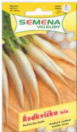
Semena Veleliby přináší na obrázku ředkvičky štíhlé a navíc i řez bulvičkami.