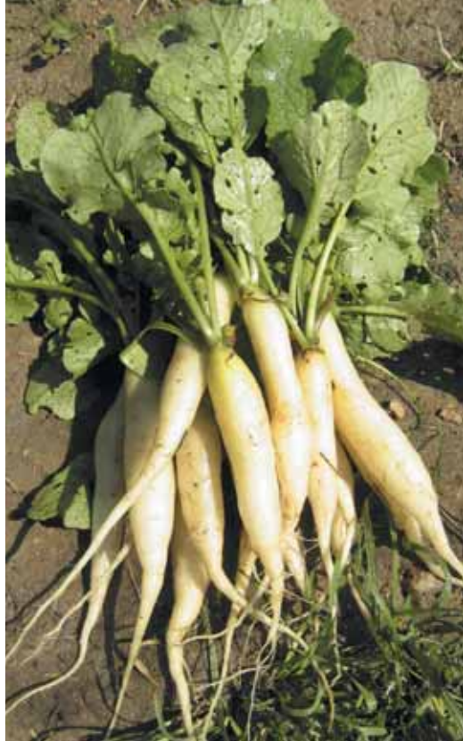
Skutečné, doma vypěstované Rampouchy. Některé rostliny vykazují tloušťnutí ke konci bulvičky.

Zatímco cena dříve byla na sáčku přímo vytištěna, byť SMC (stanovená maloobchodní cena?) je v případě Sempry prázdné políčko a cena je uvedena spolu s dodatečně dotištěnými údaji o množství semen a záruce. Balení se zárukou do 30. 9. 1992 stálo 1,70 Kčs. Novější balení ze současnosti stojí např. 10 Kčs. Dnes jsou osi-