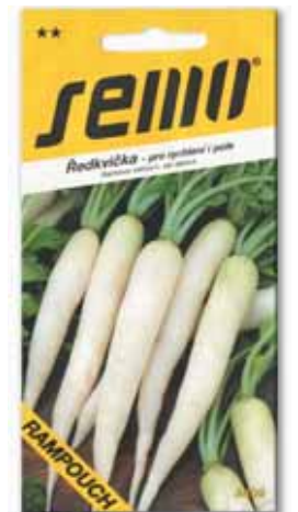
Největší sáček, avšak se stejným množstvím osiva, je ze Sema.

Na sáčku Sempra je naopak obraz bulviček kratších, bachratějších, ba některých téměř válcovitého tvaru. Slovenské balení Semexu ukazuje jen tři bulvičky, které ale vypadají hodně nevyrovnaně a ne zcela dokonale. Je to ve stylu „každý pes jiná ves“ a spíše než pohledné ředkvičky tu vidíme jakési „křivouse“, každá ředkvička je jinak křivá. Na novějších sáčcích po roce 2000 jsou všude na první pohled krásné a dokonalé ředkvičky. Pěkné a bezvadné ředkvičky jako by vyjadřovaly touhu po kráse a dokonalosti. Při pozornějším pohledu je ale také každá trošičku jiná, některá mírně zakřivená, jiná rovnější, některá kratší a jiná delší apod. Jde o přirozený jev, variabilitu „kořenů“, jíž se lze sotva vyhnout. Na podobu kořenů mohou mít vliv jak vnější podmínky, způsob ošetřování, tak mohou být ovlivněny původem. Bylo by zajímavé srovnat různé původy této odrůdy z domácích i zahraničních zdrojů. Na fotografii ze sáčku Sempra pak lze vytušit poškození listů dřepčíky, většinou však mnoho z listů na sáčcích není zobrazováno.