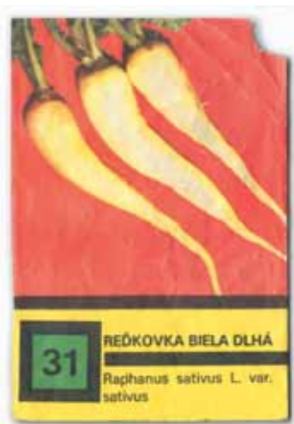
Hodně křivé bulvičky se podařilo vybrat na sáček Semexu. ➔