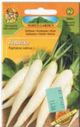
Nohel Garden uvádí přibližný počet semen v sáčku (400) a má na zadní straně návod k pěstování dokonce v sedmi jazycích.

ko). Kromě celých bulviček je ve dvou případech na fotografiích i řez bulvičkami (Semena Veleliby a u švýcarského Selectu). Z pohledu na dužinu lze soudit na kvalitu – u některých odrůd může být někdy vidět nádech zbarvení dužiny a při pozorném pohledu na originál lze třeba rozpoznat u dužiny počínající houbovatění (mechovatění). Jistě tak může přínést doplnění řezu bulvičkami na obale celistvější, úplnější představení odrůdy.