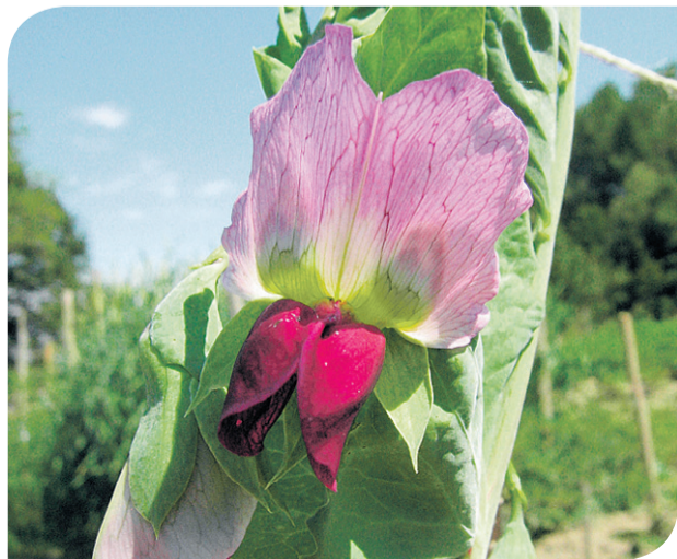
Farebný kvet je veľmi dekoratívny.

Tento hrach je nezvyčajný tým, že sa konzumujú celé struky.