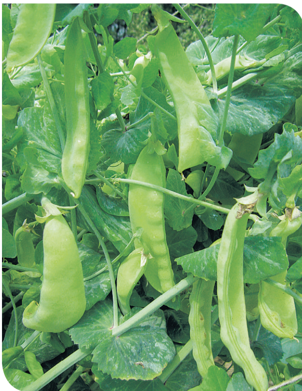
Struky cukrového hrachu. Takto vyzeral hrach, ktorý si pán doktor Jančuška ako malý chlapec trhal z okna.