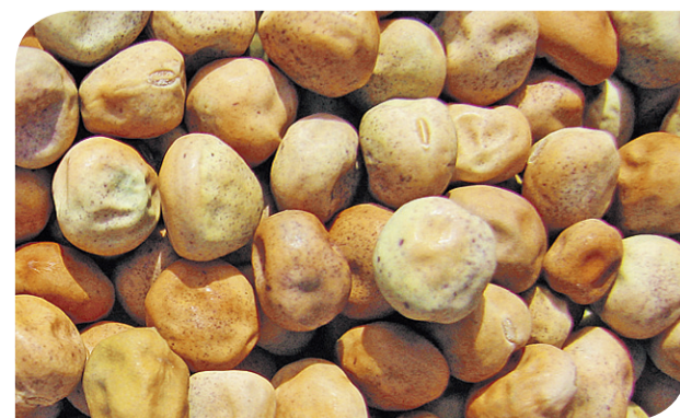
Semená sú veľké, hnedastej farby a držia si klíčivosť niekoľko rokov.