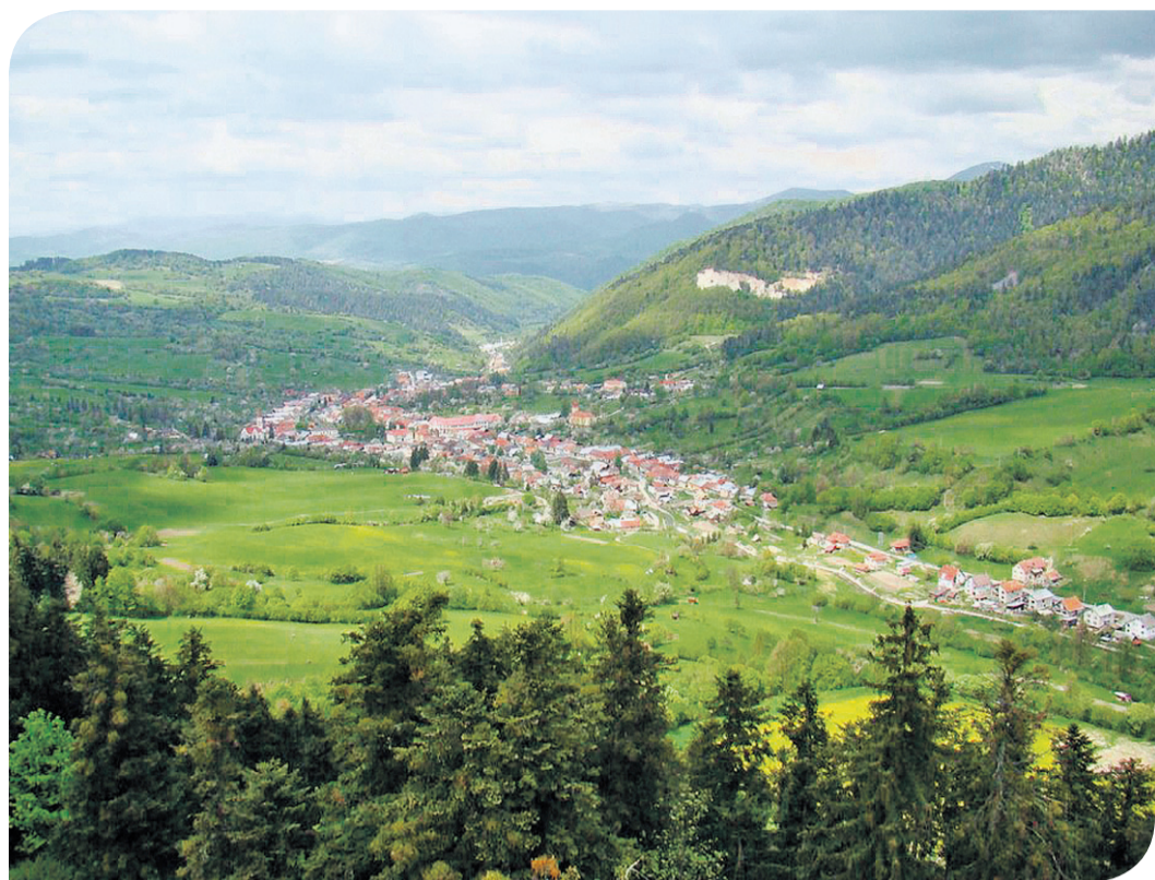
Lubietová obkolesená vencom lúk a hôr.